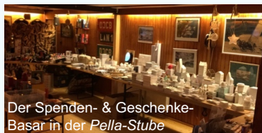
Der Spenden- & Geschenke-Basar in der Pella-Stube